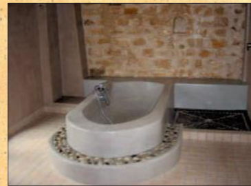
Tadelakt im Bad