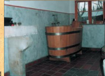
Stuccolustro im Bad