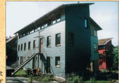
Fassade mit Holzlasur