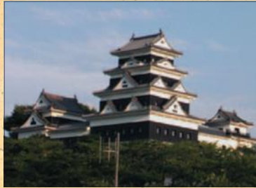
Holzlasur außen, pigmentiert Schloß in Japan

Kasein, Kreide, Marmorlehme, Marmorerde, Borax, Quarzmehl, Sumpfkalk, Gummi arabicum, Balsamterpeninöl, Orangenschalenöl, Alkohol, Leinölfirnis, Leinölstandöl, Safloröl, Lackleinöl, Holzölstandöl, Sikkativ, Harzöl, Schellack, Bienenwachs, Carnaubawachs, Soda, Zitronensäure, Bicarbonat.