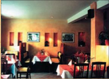
Wandlasur in einem Restaurant

Alle Farben sind voll diffusionsfähig und von natürlichem Weiß, ohne Titandioxide.